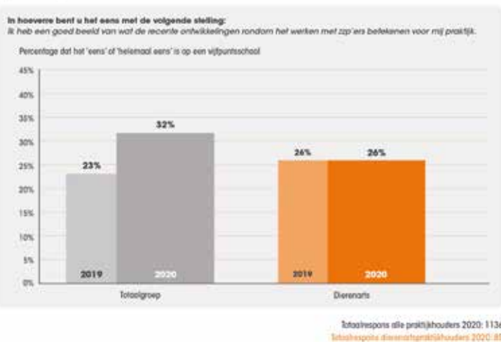
figuur 1: Beperkt zicht op impact zzp-wetgeving bij dierenarts-praktijkhouder.