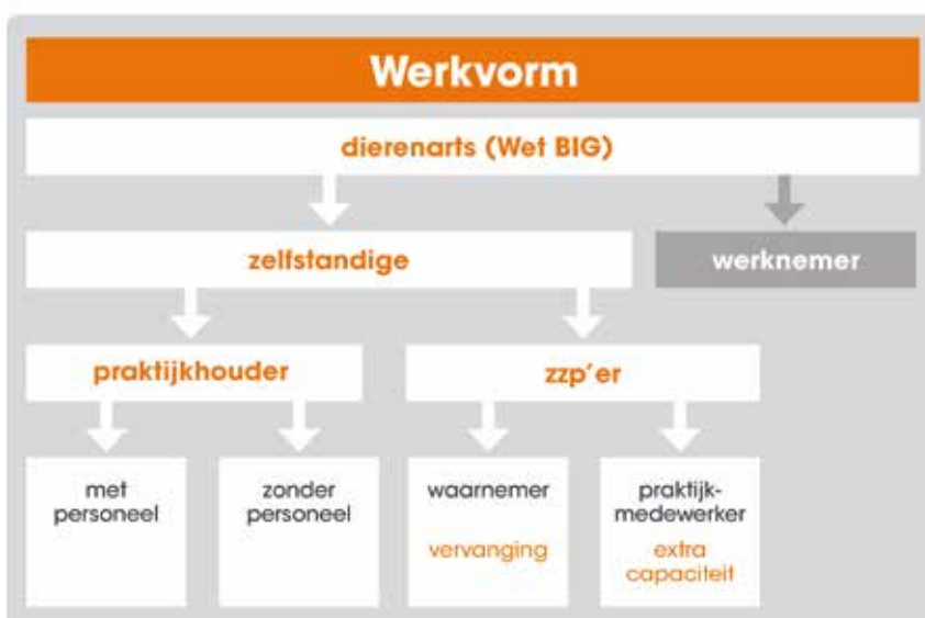
Figuur 2: Werkvormen zelfstandige dierenartsen.