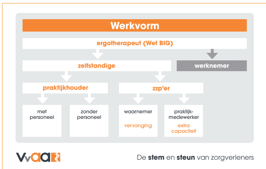
Werkvormen ergotherapeuten. Soorten en maten zelfstandigen