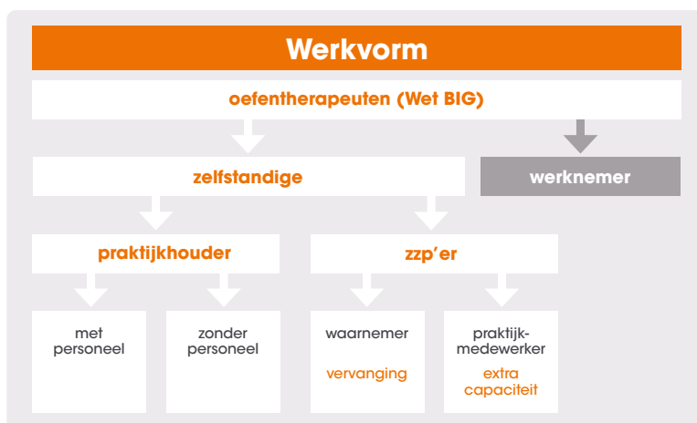
Figuur 2: Werkvormen zelfstandige oefentherapeuten

Figuur 2 geeft een totaaloverzicht van de vormen waarin een zelfstandig oefentherapeut werkzaam kan zijn. Beide overeenkomsten hebben momenteel hun fiscale waarde nog: werken met én conform de overeenkomst betekent dus werken buiten dienstbetrekking. Er is dan bijvoorbeeld dus geen inhoudingsplicht van loonbelasting en sociale premies. ➔