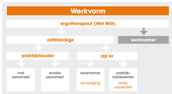
Figuur 2: Werkvormen ergotherapeuten Soorten en maten zelfstandigen

Figuur 2 geeft een totaaloverzicht van de vormen waarin een zelfstandig ergotherapeut werkzaam kan zijn. Beide overeenkomsten hebben momenteel nog hun fiscale waarde: werken met én conform (!) de overeenkomst betekent dus in ieder geval voorlopig nog werken buiten dienstbetrekking. In dat geval is er dus geen inhoudingsplicht van loonbelasting en sociale premies.