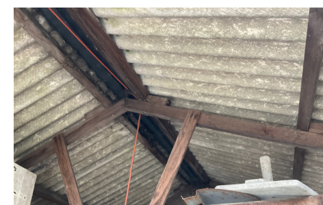
Telhas de fibrocimento na garagem