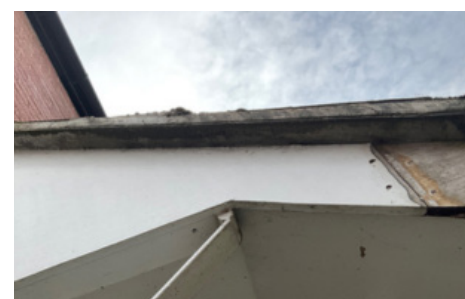
Amianto contendo subcapa de cimento até copa