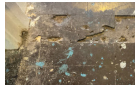
Asbesto turinčios grindų plytelės ir bitumo klijai