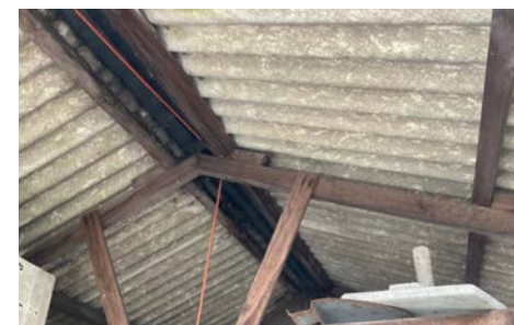
Asbestcemenčio stogo dangos lakštai ant garažo