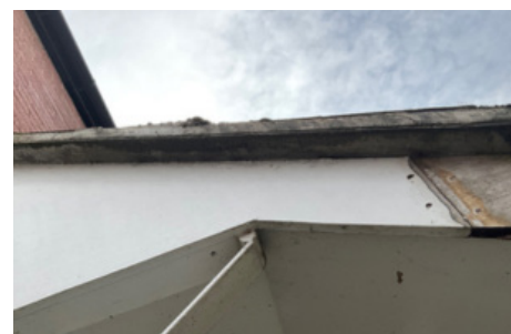
Cementowa osłona pod zadaszeniem zawierająca azbest