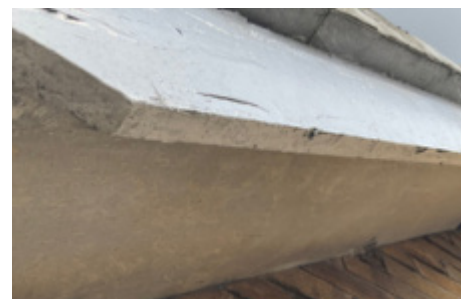
Cementowy spód stropu przy dachu zawierający azbest