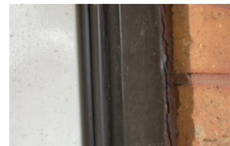
Masa uszczelniająca do ramy okiennej zawierająca azbest