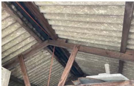
چيمه ننتوی ناسبيستهسی شيلمانی سه ر گراج