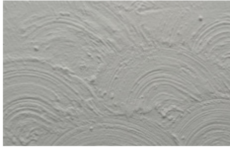
ناسبيستهس که روپوشي نه خشتداری سه قفی تيدايه (ARTEX)