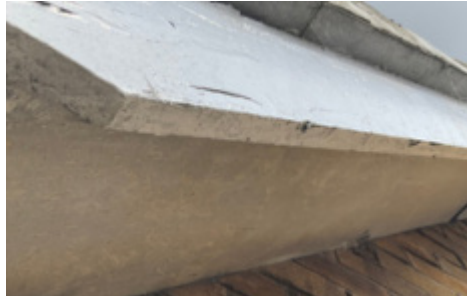
بوردی چيمه ننتوی ناسبيستهس بو سه ريان