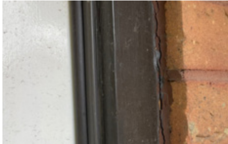
ناسبيستهس که چه سپ يان مهستهکی چوار چيوهی په نجره ی تيدايه