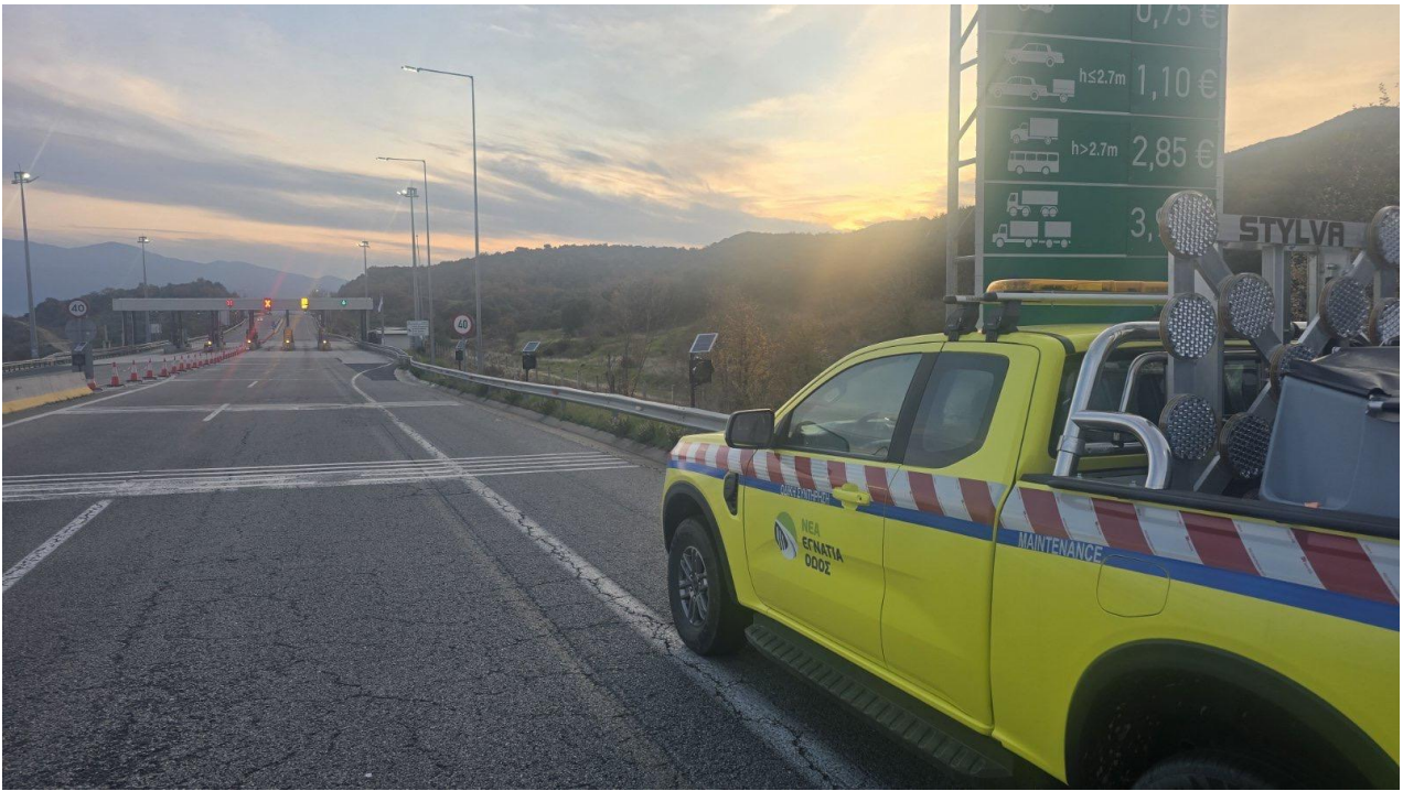
Véhicule d'exploitation en service