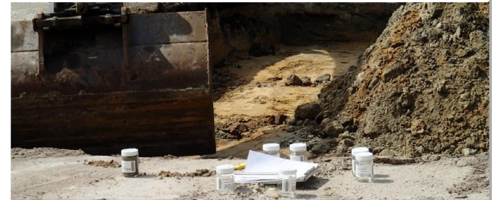
BRL SIKB 7000