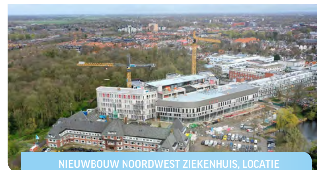
NIEUWBOUW NOORDWEST ZIEKENHUIS, LOCATIE ALKMAAR. VISSER EN SMIT BOUW VESTIGING AMSTERDAM