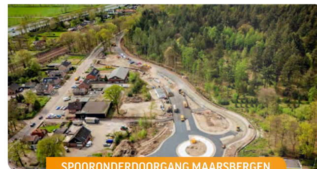
SPOORONDERDOORGANG MAARSBERGEN, HEGEMAN BOUW & INFRA