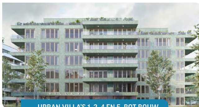
URBAN VILLA'S 1, 2, 4 EN 5, BOT BOUW

In 2024 deden 36 projecten in onze regio mee aan de Dag van de Bouw.