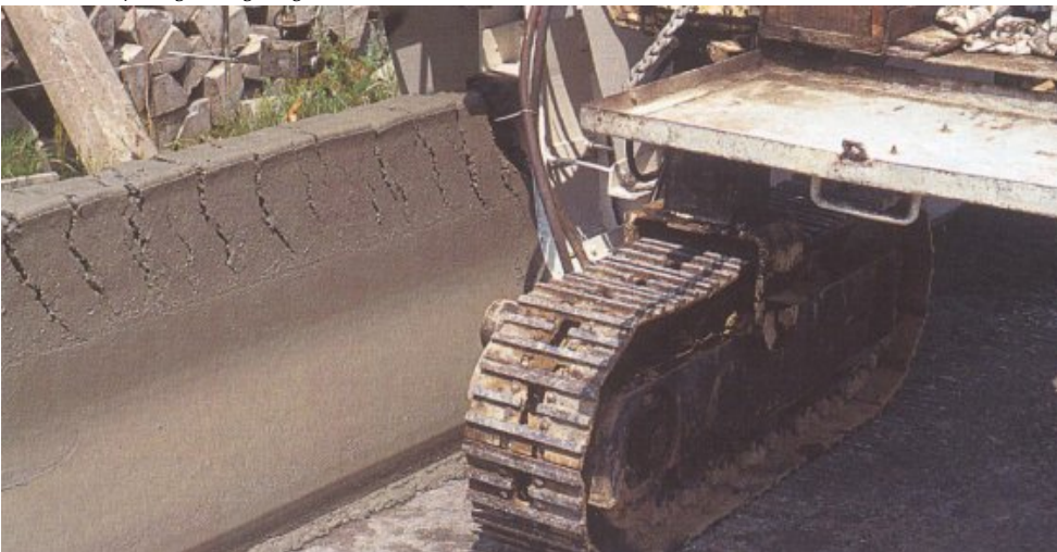
Trekscheuren bij aanleg voertuigkering

Dergelijke scheuren zijn soms heel fors en geven aan dat er iets structureel mis is. Stoppen met storten en de oorzaak verhelpen is meestal de enige remedie. Het gedeelte met de trekscheuren zal gewoonlijk gesloopt moeten worden.