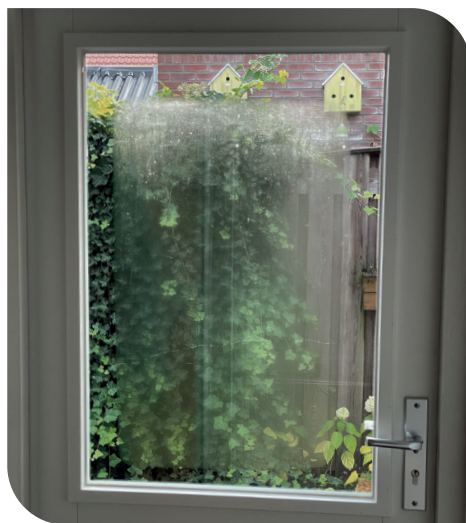
Condensvorming aan de kamerzijde.

Condensvorming aan de kamerzijde ontstaat meestal bij een lage buitentemperatuur en een hoge relatieve luchtvochtigheid in de woning. Het aanwezige vocht condenseert dan tegen het glasoppervlak. Bij isolerende beglazing met een goede isolatiewaarde zoals Hoog-Rendements isolerend dubbelglas is dit risico kleiner dan bij glas met een slechte isolatiewaarde zoals enkelglas. Dit is ook afhankelijk van de specifieke situatie. Belangrijk is te weten dat condens aan de kamerzijde geen fout in het product is. Eventuele condensvorming is te voorkomen door goed te ventileren. Zeker als je de bestaande beglazing laat vervangen, moet dus goed worden gekeken naar de mogelijkheden om te ventileren.