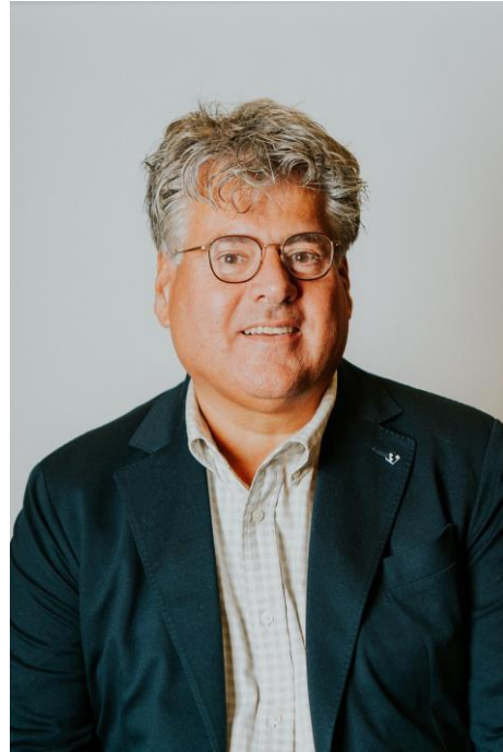
Rein Croonen Aannemersbedrijf De Wit Drunen/Breda