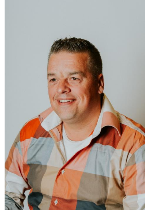
Bart Nouws Bouwbedrijf Nouws