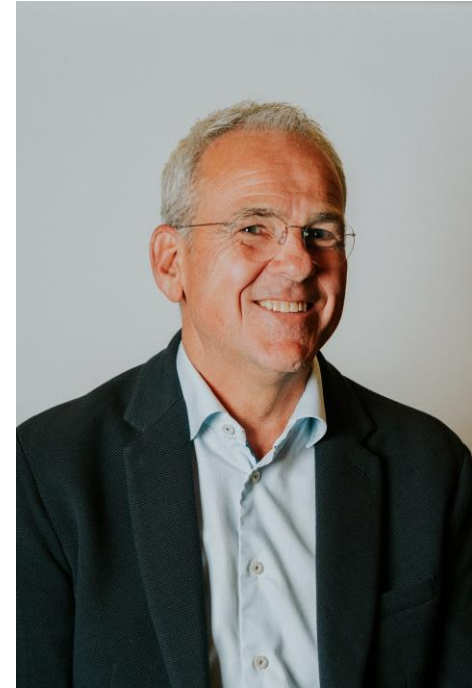
Willem-Jan Aarsen Maas-Jacobs Bouwbedrijf