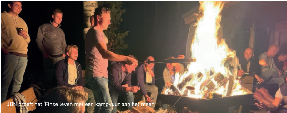
JBN proeft het 'Finse leven met een kampvuur aan het meer.