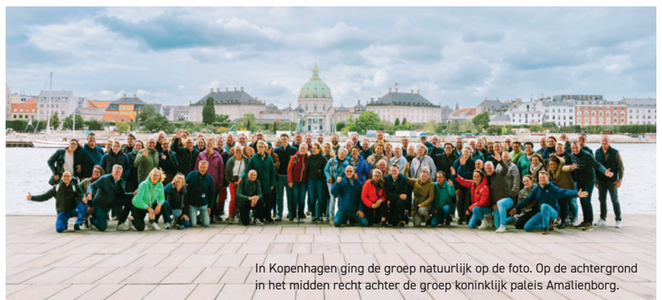
In Kopenhagen ging de groep natuurlijk op de foto. Op de achtergrond in het midden recht achter de groep koninklijk paleis Amalienborg.

Een fietstour met architectonische hoogtepunten, een bezoek aan Copenhill, een bezoek aan het Museum of Modern Art en een bezoek aan de derde stad van Zweden, Malmö. Het waren de belangrijkste ingrediënten van de ledenreis naar Kopenhagen. Van 26 t/m 29 september sloten ruim veertig leden en hun partners aan tijdens de trip naar de Deense hoofdstad. Met een afwisselend sportief, cultureel en spannend programma kwam iedereen volledig aan zijn trekken. Het was een fantastische reis en een perfecte manier om elkaar beter te leren kennen. De onderlinge banden zijn weer aangehaald.