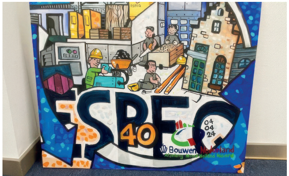
Schilderij van Leon Römer, door Bouwend Nederland afdeling NHN geschonken aan ESPEQ. Het werd gemaakt aan de hand van foto's die zijn gemaakt tijdens de intake bij Espeq op 17 juni jl. Tijdens de intake worden starters getoetst op de benodigde vaardigheden en wordt gekeken of de opleiding bij ze past.

Dat is ten eerste gebeurd door de kwaliteit van de opleiding op te krikken en die aan te vullen met onder meer extra cursussen,